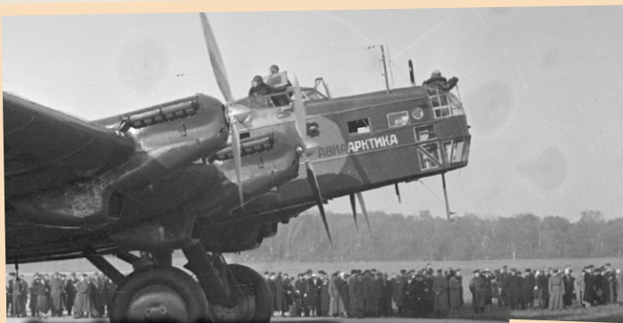
Самолёт Н-212 «Авиарктика» на Московском аэродроме перед полётом на Северный полюс, 1937 г.