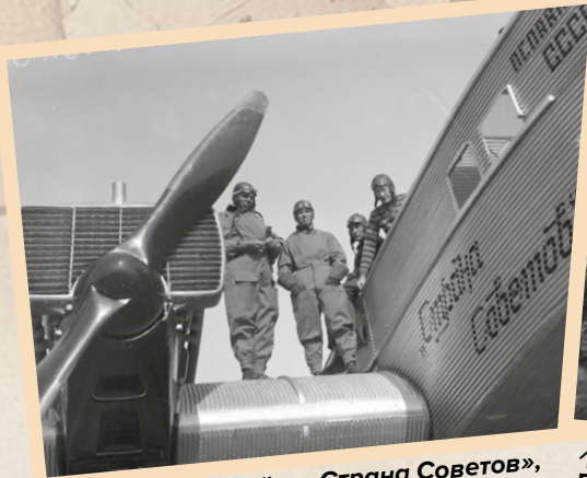
↑ Экипаж самолёта «Страна Советов», совершивший в 1929 г. перелёт Москва — Нью-Йорк, 1929 г.