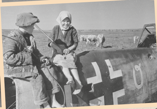
← Украинские дети одной из освобождённых деревень в районе г. Глухова (Сумская область) сидят на сбитом немецком самолёте, 2 сентября 1943 г.