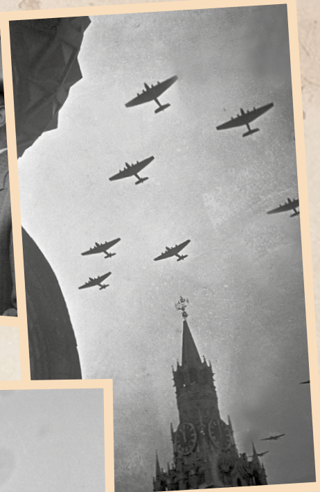
↑ Самолёты пролетают над Красной площадью во время Первомайского парада, 1935 г.