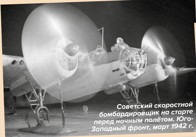
Советский скоростной бомбардировщик на старте перед ночным полётом. Юго-Западный фронт, март 1942 г.