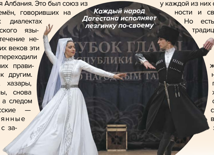
Каждый народ Дагестана исполняет лезгинку по-своему

Среди важных традиций республики — знаменитая дагестанская свадьба, которая отличается особой пышностью и размахом. Готовиться к ней начинают чуть ли не с рождения ребёнка: собирают приданое для дочерей, копят деньги на выкуп невесты и на сам праздник. Шутка ли — достойно встретить и накормить от 500 до 1500 гостей!