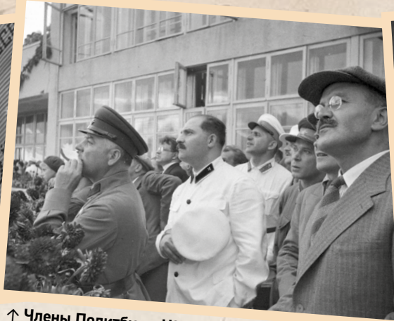
↑ Члены Политбюро ЦК ВКП(б) К.Е. Ворошилов, Л.М. Каганович, В.М. Молотов и др. советские работники на празднике Дня авиации в Тушино, 18 августа 1935 г.