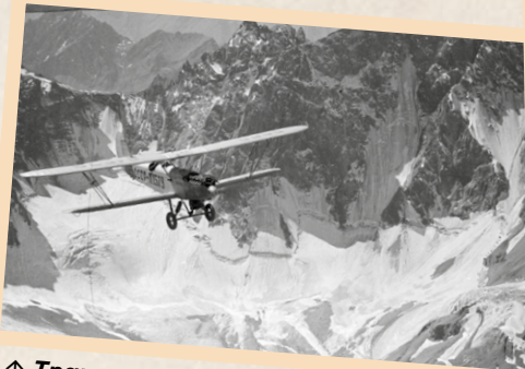
↑ Транспортный самолёт П-5 (бортовой номер СССР-Л1579) в полёте над горами Памира (Горный Бадахшан) в ходе рейса на среднеазиатской авиатрассе Хоруг — Сталинабад, 1936 г.