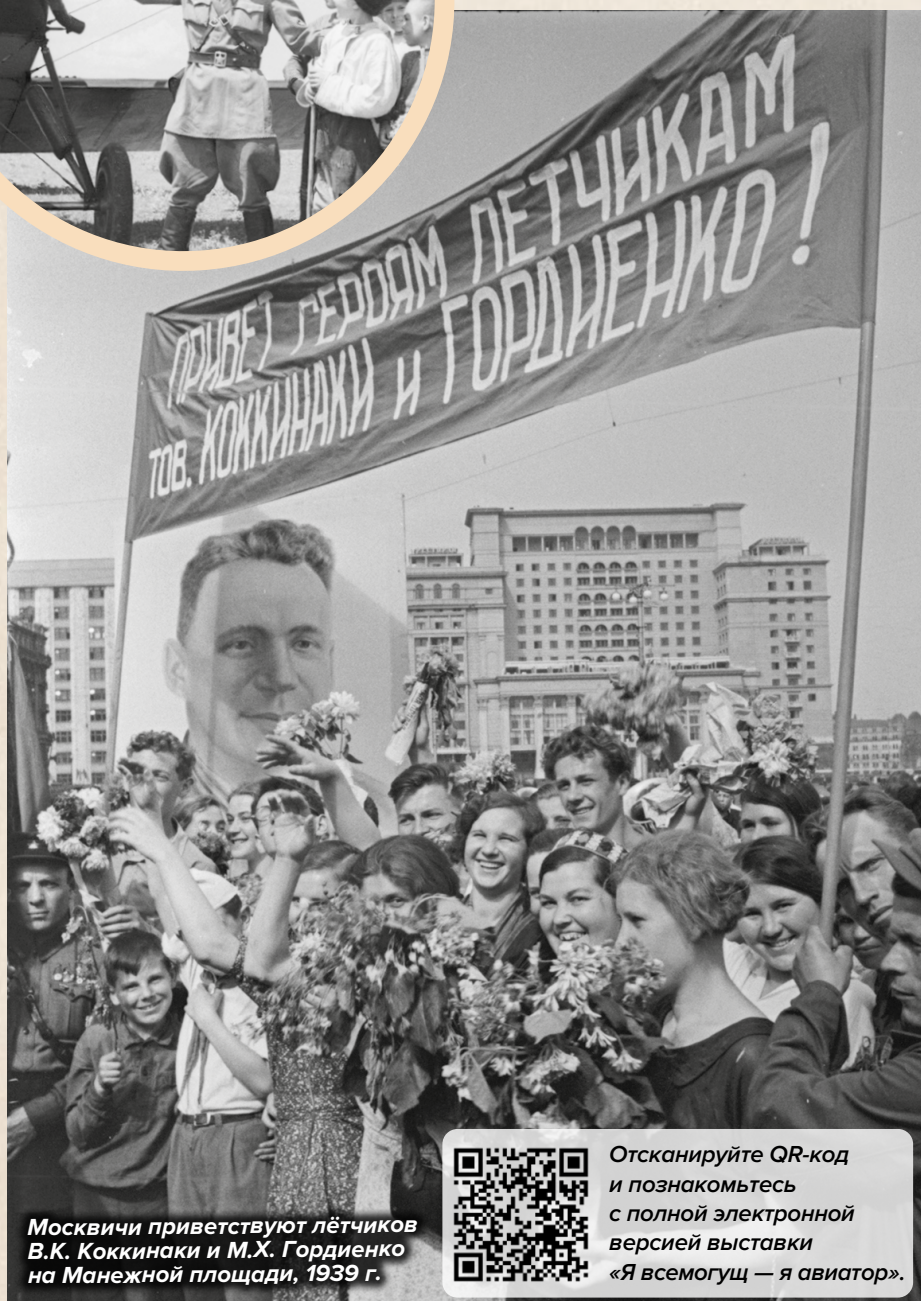
Москвичи приветствуют лётчиков В.К. Коккинаки и М.Х. Гордиенко на Манежной площади, 1939 г.