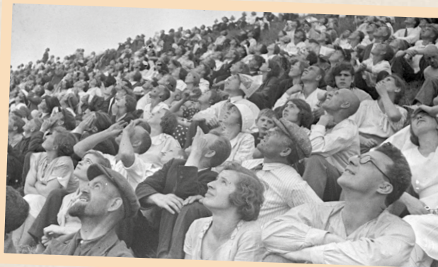
↑ Зрители на Тушинском аэродроме наблюдают за фигурами высшего пилотажа лётчика В.К. Коккинаки во время авиационного парада по случаю Дня авиации, 18 августа 1937 г.